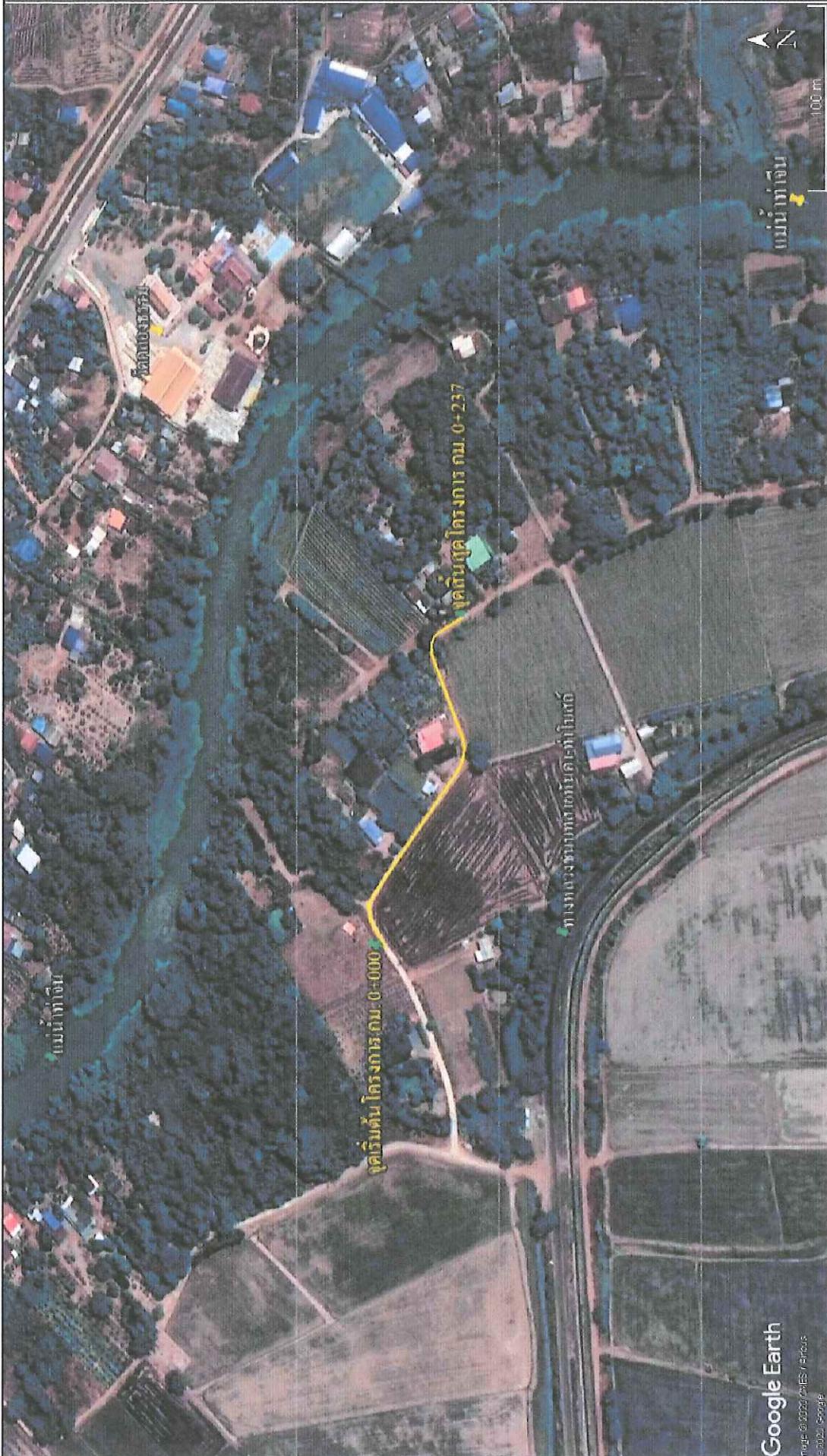
รูปผังบริเวณงานก่อสร้างถนนคอนกรีตเสริมเหล็ก หมู่ที่ 4