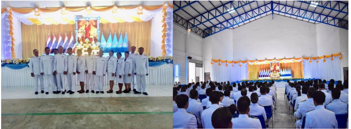
จัดกิจกรรมเฉลิมพระชนมพรรษาพระบาทสมเด็จพระเจ้าอยู่หัว