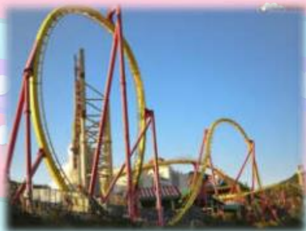
บ่อบำบัดน้ำเสียเครื่องเล่นในสวนสนุก