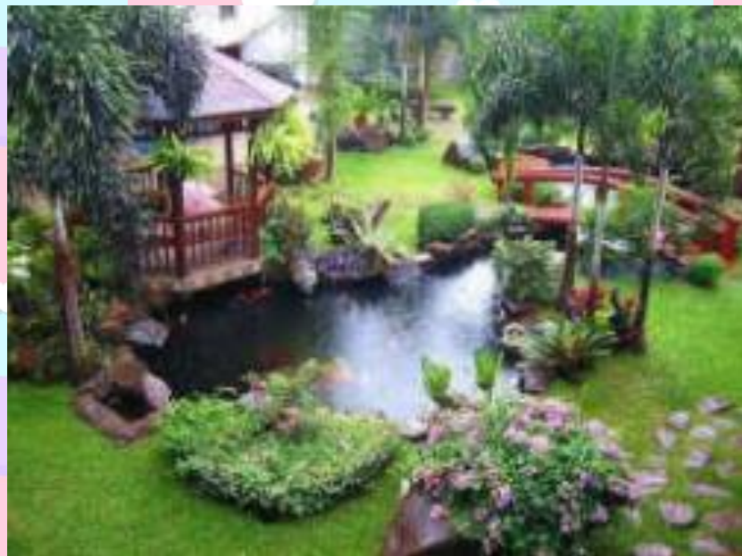
สวนหย่อม แผงโซลาเซลล์