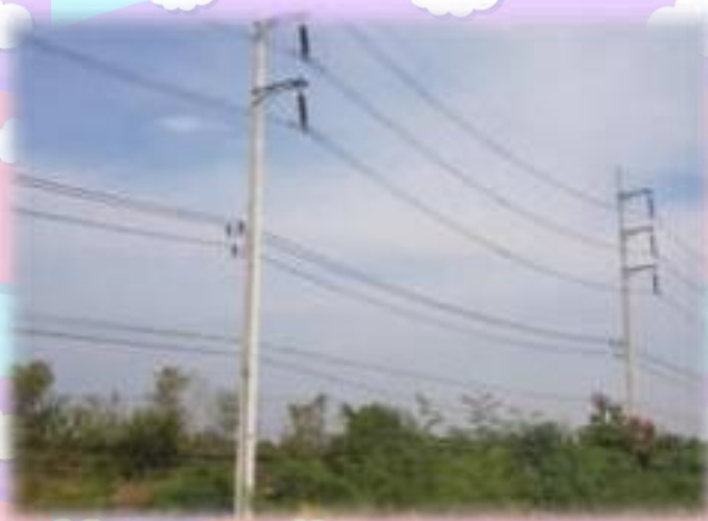
เสาไฟฟ้า