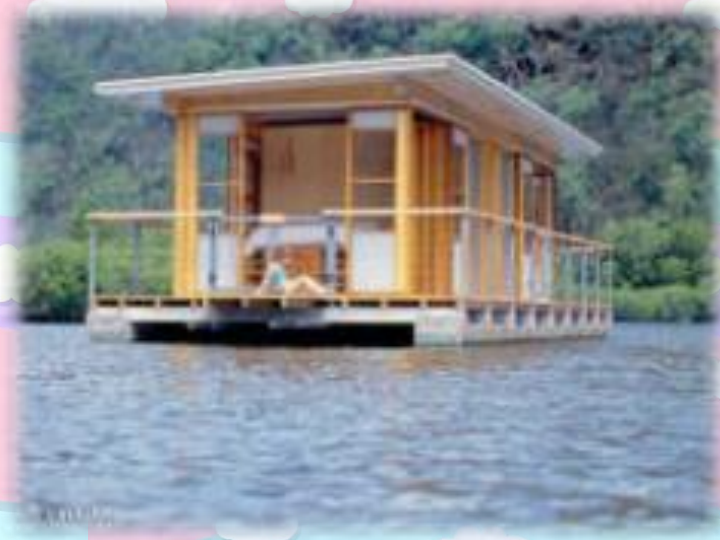
บ้านเรือนแพ