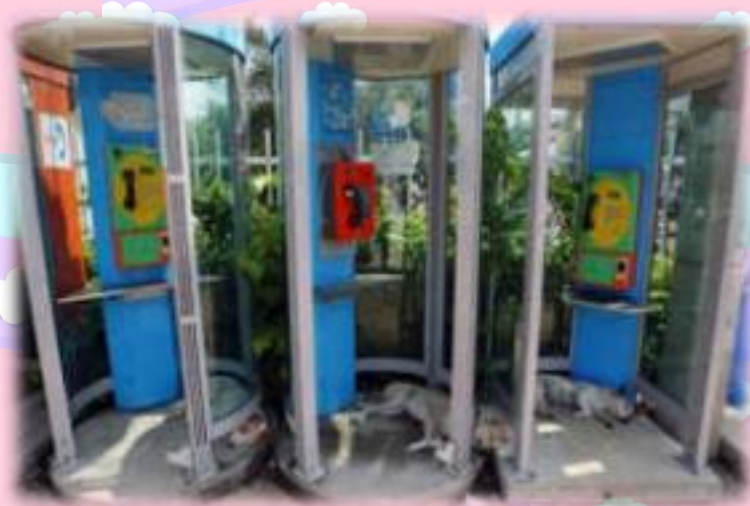
ตู้โทรศัพท์สาธารณะ