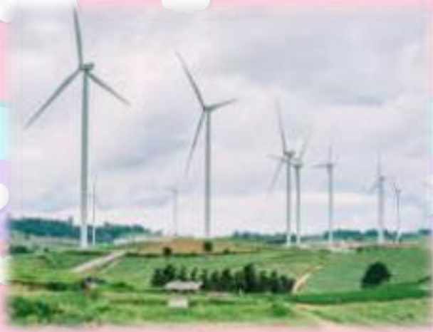
กังหันลม