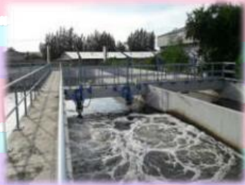
บ่อบำบัดน้ำเสีย