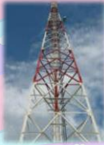
เสาส่งสัญญาณอินเทอร์เน็ต

ตัวอย่างสิ่งปลูกสร้างที่อยู่ในข่ายได้รับการยกเว้นภาษี