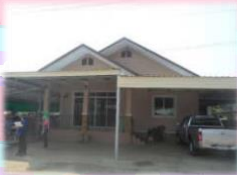
บ้านเดี่ยว